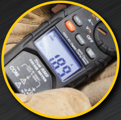
Pantalla LCD retroiluminada

Botón de encendido y apagado para el modo NCV