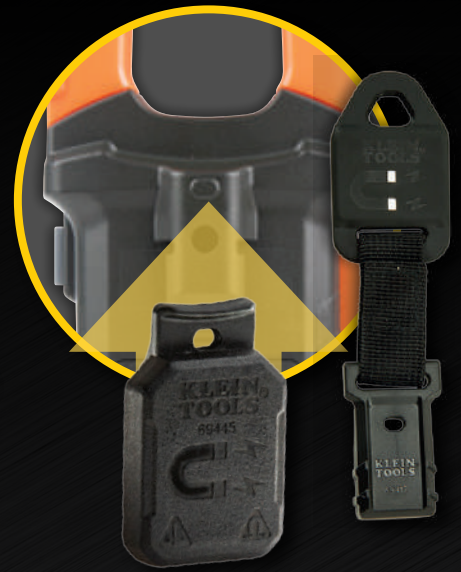
Soporte magnético con y sin correa 69417 y 69445 (opcional)

Conectores de entrada de cables de prueba