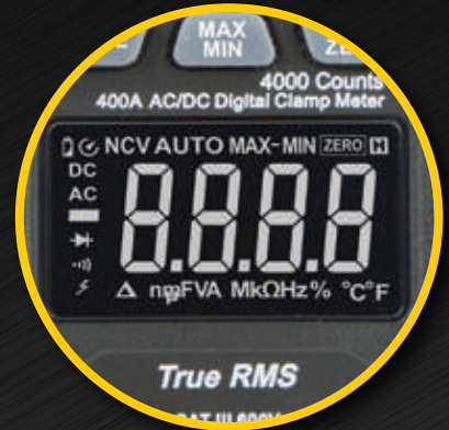
CL390 con pantalla de contraste invertido