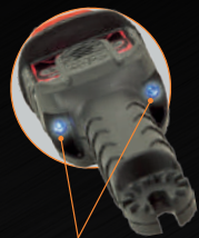
La señal visual indica la presencia de voltaje.