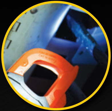
Luz de trabajo (solo CL800)

Antena de detección de NCV que detecta la presencia de voltaje CA