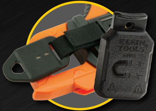
Soporte magnético con y sin correa 69417 y 69445 (opcional)

Soporte para cables de prueba para trabajar en modo manos libres