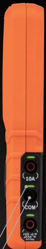
MM450 VISTA LATERAL