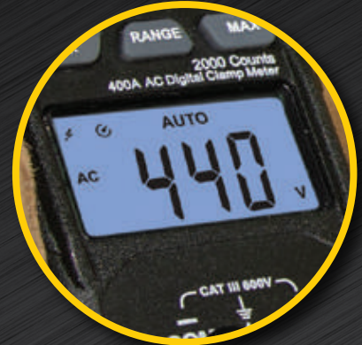
CL320, CL220 y CL120 con pantalla retroiluminada